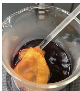
(b) ミョウバン液で媒染後の絹