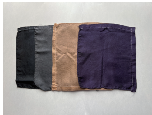
2.2(a)2 図1 基本の染め方で染色後の絹(P.70)