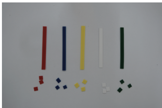
2.2(c)4 図1 実験で用いたプラスチック片(P.158)