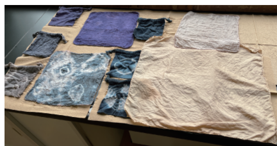
2.2(a)2 図4 探究実験の作品(P.71)